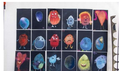
Les bonshommes patates