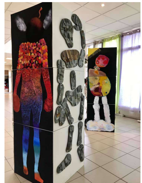
Totems